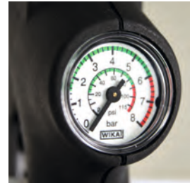
Ergonomiczny zawór spustowy z manometrem