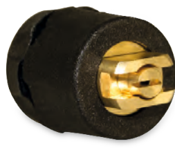
Dysza płaska 80-04 E dla gęstych środków