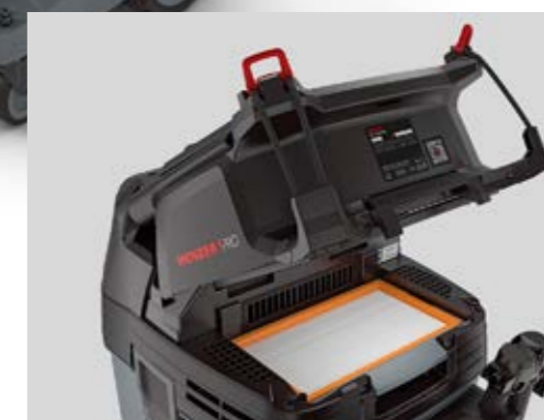
Automatyczny system oczyszczania filtra