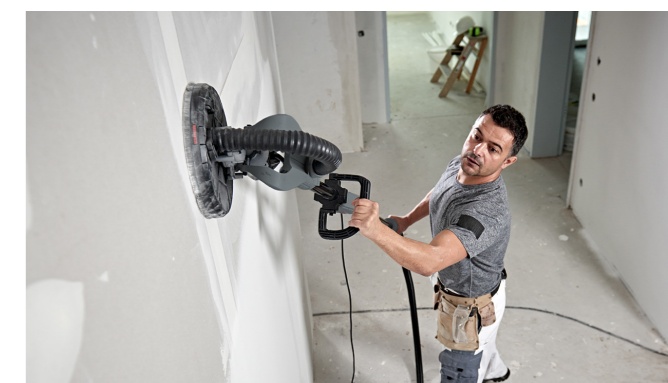
Elastyczna głowica szlifierska precyzyjnie podąża za każdym ruchem.