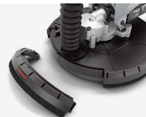
Zdemontowana przednia część otoku szczotkowego tarczy do prac w narożnikach.

opiera się na koncepcji maszyny zaprojektowanej do ciągłego użytku profesjonalnego. Inteligentna elektronika z łagodnym rozruchem i zabezpieczeniem przed przeciążeniem, wyjątkowo mocny silnik z bardzo dużymi rezerwami mocy oraz niezużywający się bezpośredni napęd tarczy szlifierskiej sprawiają, że nawet najtrudniejsze wyzwania są pokonywane bez wysiłku.